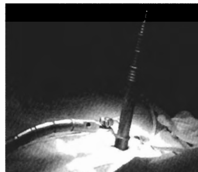
Afbeelding 1: Positie cilinders en flexibele arm